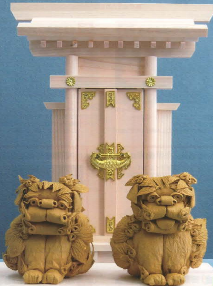
高際 牧子 先生作品「狛犬」10/17(火)・11/21(火) 連続教室 ※詳細は教室のご案内ページをご覧ください。講師のご紹介も掲載しています。

■お教室のお申し込みは Tel.03-3811-4025 Fax.03-3815-3348