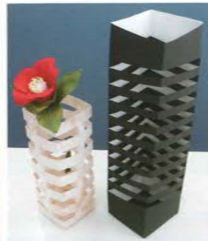
10月 (花は撮影用です)

折りの花器は皆様に喜ばれていますが、今回は切り込みを入れる物です。不思議な動きが見られます。菊は大変ですが花卉が管状になる菊を作ります。